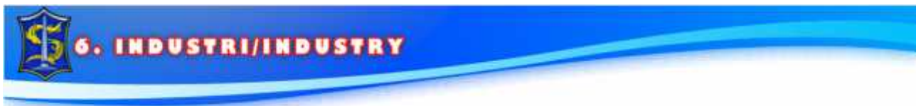
Tabel 6. Lanjutan