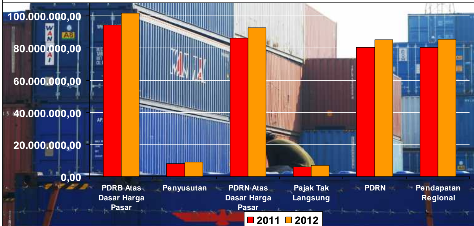
Gambar 10.1 Susunan Agregat Produk Domestik Regional Bruto dan Pendapatan Regional Kota Surabaya Menurut Harga Konstan 2000 Gross Regional Domestic Product Agregate and Regional Income Surabaya City at Constant Price of 2000 2011 – 2012 (000.000 Rp )

Sumber : Bappeko Surabaya Source : Surabaya City Development Planning Agency